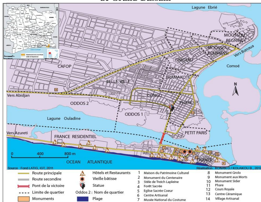
Figure 2 : Distribution des sites touristiques majeurs dans la ville de Grand-Bassam

Du fait des sites variés (figure 2), Bassam réunit à la fois les atouts d'un tourisme culturel, gastronomique, artisanal et balnéaire (Sangho, 1993).