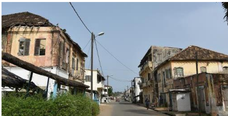
Figure 4: Le quartier France, vestige du passé glorieux de la première Capitale ivoirienne