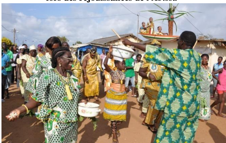
Figure 6: Parade populaire du peuple N'Zima dans les rues lors des réjouissances de l'Abissa

folklore. Bassam est la première localité culturelle de la Côte d'Ivoire. Très tôt foyer de convergence ethnique ivoirienne et africaine, la ville est un brassage culturel reconnu. Cependant, la culture des autochtones N'Zima et Abouré a su s'imposer au travers des fêtes de génération et de l' Abissa (figure 6)