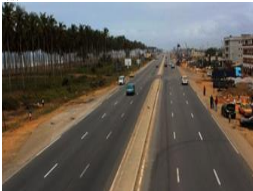
Figure 7 : La nouvelle Autoroute flambant neuve à 2x3 voies reliant Abidjan-Grand-Bassam

Bassam en 15 minutes et surtout de réduire les embouteillages. Il s'agit, selon Patrick Achi 1 , ministre des infrastructures économiques, « de la remise à neuf de la route longue de 16,3 km puis de la construction de l'autoroute elle-même qui comprend une section urbaine longue de 8,5 km en 2x3 voies qui va du carrefour Akwaba jusqu'au corridor de Gonzaque ville, puis d'une seconde qui part de ce corridor jusqu'au pont de Moossou sur 19,9 km en 2x3 voies également, soit 30 km d'autoroute ». Débutés en septembre 2012, les travaux de l'autoroute (figure 7) Abidjan-Bassam ont pris fin en février 2015.