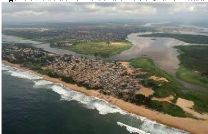
Figure 3: Vue aérienne de la ville de Grand-Bassam

L'histoire prédestine Bassam à une vocation touristique (Sangho, 1993). Construit à partir de 1843, son site originel se constitue de plus de 60 maisons monumentales qui lui donnent un aspect de vieille ville d'architecture européenne transplantée dans un paysage africain (Abe, 1978). Aussi, s'est-elle structurée autour des lagunes (Ebrié, Ouladine, Potou), fleuve Comoé, cordon littoral boisé et de la plage le long de l'Océan Atlantique (Figure 3).