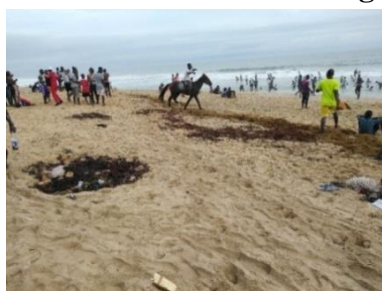
Figure 9 : Plage insalubre

Le tourisme balnéaire pratiqué par les habitants d'Abidjan est important sur les plages du cordon littoral au niveau de la ville historique. En effet, le tourisme et les loisirs balnéaires dont sont friands les Abidjanais drainent beaucoup de gens pendant les week-ends sur les plages (Hauhouot, 2002). Cela entraîne le développement d'installations d'accueil et des pollutions insuffisamment contrôlées. L'activité est aussi menacée par les algues que rejettent régulièrement les vagues sur la plage (figure 9).