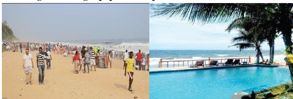
Figure 5: Plages populaire et privée à Grand-Bassam

et Azureti façonnées par une végétation de mangroves où vit une forte population d'huîtres auxquelles s'ajoutent les cocoteraies et équipements touristiques d'intérêt majeur dans toute l'Afrique de l'Ouest.